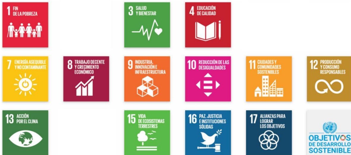
Gráfico 3 conexidad del proyecto con los Objetivos de Desarrollo Sostenible – ODS.